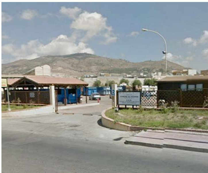
Foto 1: l'ingresso principale del CCR, Trapani

Un'area di ingresso in macchina con pesa per valutazione rifiuti ingombranti, corpo basso a destra dell'ingresso con ufficio (un operatore) e terminale della pesa (foto 1); un'area centrale con zone posteggio marcate sull'asfalto (numero 18 posti auto); questa area è circondata da "cassoni" adibiti alla raccolta differenziata, e, sulla parte centrale destra un'area all'aperto (coperta con struttura in legno) riservata alla pesa delle singole componenti. In quest'ultima area sono organizzati già dei corridoi di accesso (di larghezza superiore al metro) che conducono gli utenti alle pesa (numero due) dove si trovano due operatori (uno per pesa) addetti esclusivamente alla pesa e alla registrazione dell'utente. Da questa area si esce, verso il piazzale centrale, da un'uscita diversa da quella di entrata. Una volta pesati i rifiuti, gli utenti si recano nel piazzale a depositare i rifiuti negli appositi cassoni (foto 2).