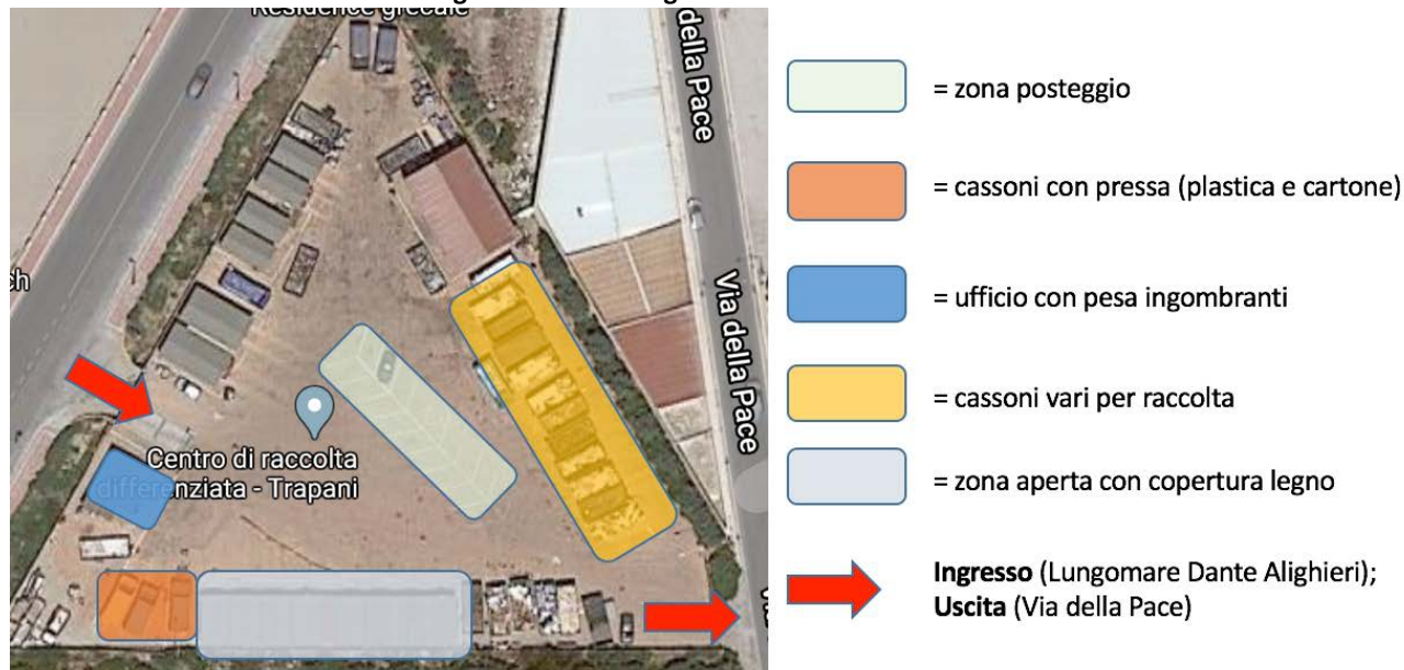
Foto 2: vista dall'alto del CCR del Lungomare Dante Alighieri con indicazione di destinazione d'uso delle diverse aree