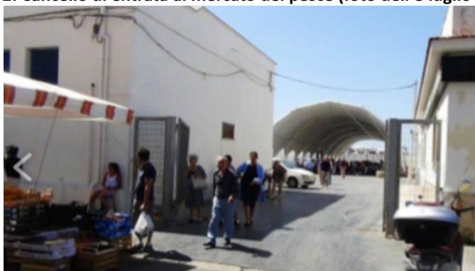
Foto 2: Cancello di entrata al mercato del pesce (foto dell'8 luglio 2019).

Agli spazi del mercato del pesce l'utenza può accedere da un ingresso (cancello principale) sito in via Cristoforo Colombo, di una larghezza tale da consentirne la divisione in due parti (foto 2).