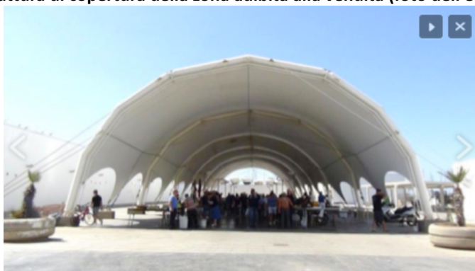
Foto 1: struttura di copertura della zona adibita alla vendita (foto dell'8 luglio 2019)

Agli spazi del mercato del pesce l'utenza può accedere da un ingresso (cancello principale) sito in via Cristoforo Colombo, di una larghezza tale da consentirne la divisione in due parti (foto 2).