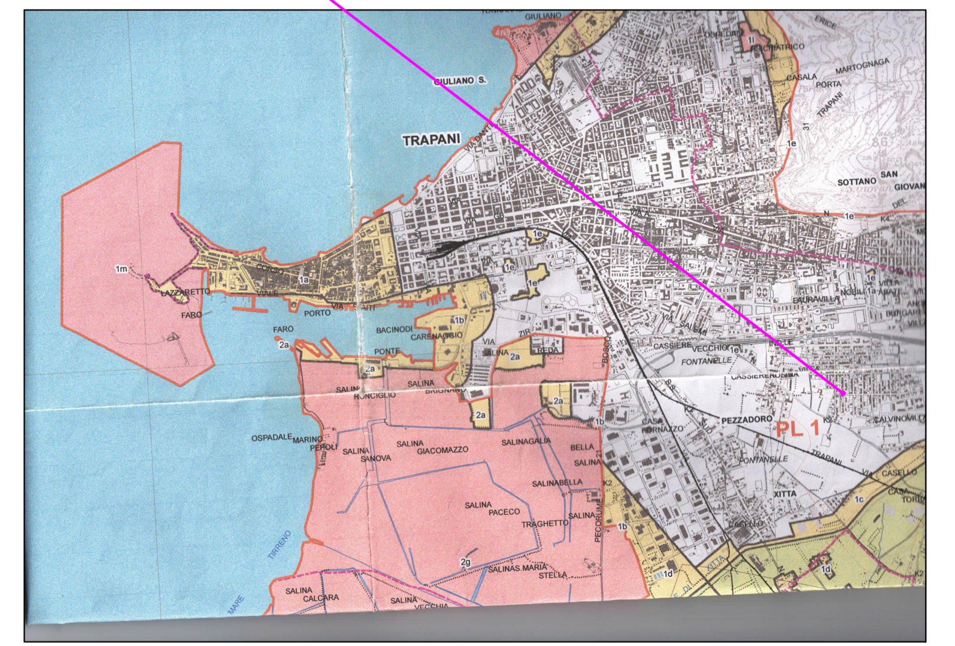
Stralcio Piano Paesaggistico